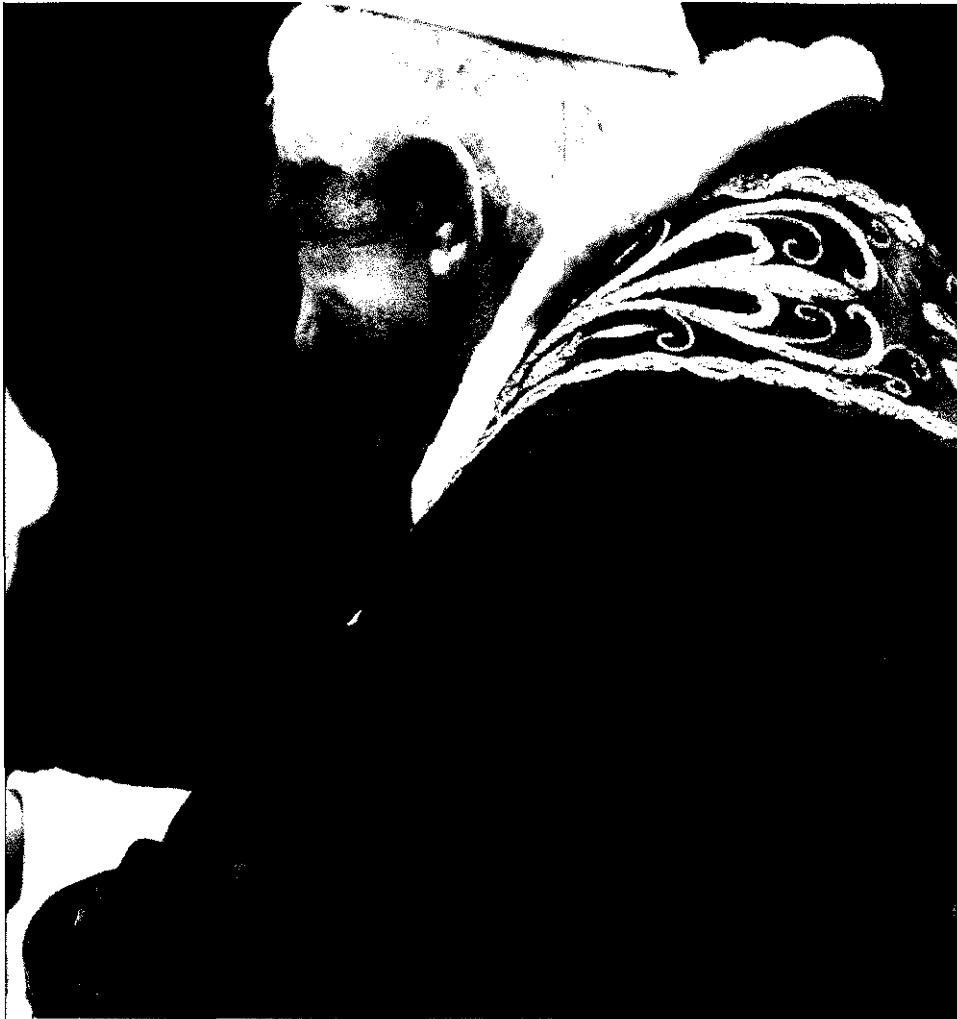
El padre Kolvenbach saluda a Benedicto XVI en un acto celebrado en el Vaticano