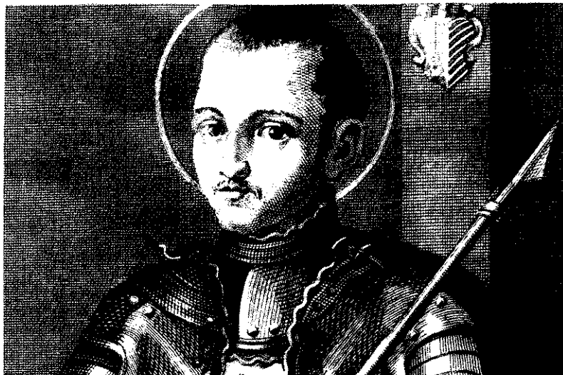
San Ignacio de Loyola, fundador de la Compañía de Jesús