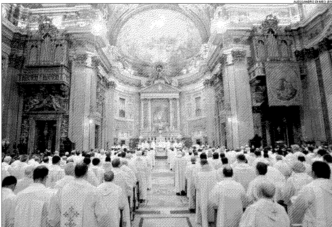
Vista general de la misa que dio inicio a la 35 Congregación General de los jesuitas en Roma (Italia) el pasado lunes 7 de enero

En los próximos días, los participantes analizarán la situación de la orden creada por Ignacio de Loyola y los retos que plantea el mundo actual y a los que quieren dar respuesta los jesuitas, entre ellos la promoción de la justicia, la ecología, la colaboración con los laicos y el diálogo interreligioso.